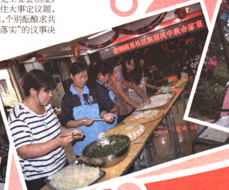
社区新居民中秋合家宴