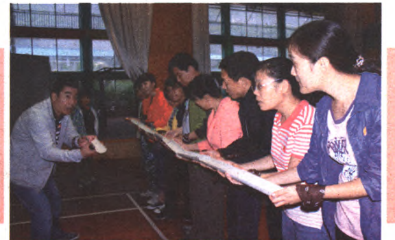
群众能力提升班拓展训练