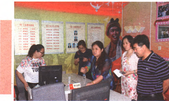
党群“服务连心港”为居民提供一站式服务

党的基层组织是党联系服务群众的桥梁和纽带,是解决“最后一公里”问题的关键节点。八角街道坚持把推进具有八角特色的服务型基层党组织建设作为此次教育实践活动的重点工程,切实在提高基层党组织服务水平、增强党组织的凝聚力、战斗力上下足功夫。在服务定位上,进一步强调“深化改革探索的就是我们要做的,发展大局要求的就是我们党要做的,满足民生需求的就是我们要办的,凝聚党员有效的就是我们党要抓的,广大居民期盼的就是我们要干的”服务理念。在服务阵地上,街道层面建立了以党群融合式发展、一体化服务为目标的党群“连心服务港”,为党(团)员提供组织“一站式”服务;在社区层面建立了北路特钢金色亲情“公益星”党员爱心小屋服务站。在服务保障上,通过对十余项人、财、物管理制度进行增、改、立,推动资源向基层倾斜,努力把基层党组织真正建成党员、群众信赖的“港湾”。