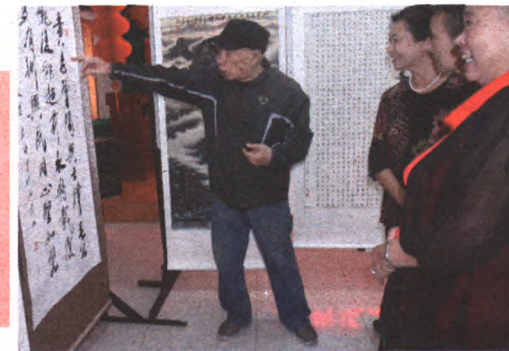
社区老干部廉政书画展