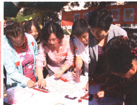
庆祝祖国65周年华诞