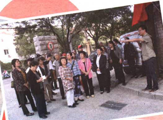
百姓监督员查看小区环境建设