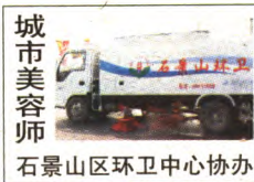
石景山区环卫中心协办

游人假日出行环境。“我们的道路清扫队及相关作业单位的人员车辆在每天清晨天亮前就已经在金顶北路、实兴大街、古城大街、香山南路等地点就位,开始日常作业。这个时间段展开作业既不会影响广大市民出行,又可以发挥人机高效率结合的作业效果。”环卫中心相关负责人如是说道。