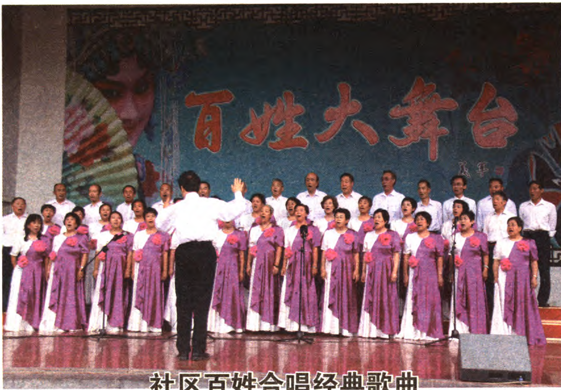
社区百姓合唱经典歌曲

本报讯(通讯员卢溪)8月28日，八角街道在文化广场举办了《八角街道纪念中国人民抗日战争胜利69周年群众歌曲大合唱》活动。来自街道19个社区的