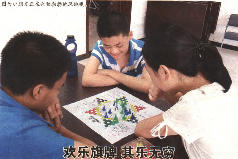
图为小朋友正在兴致勃勃地玩跳棋。

●近日，古城街道社会治理综合执法指挥中心统一部署，由交通支队牵头，针对阜石路两侧违章停车和商户门前三包开展联合整治工作，现场共处罚违章停车13辆，规范门前三包9家。辖区城管分队、派出所、工商所等部门参与此次专项整治工作。 杨显文