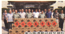
老山街道慰问驻区部队