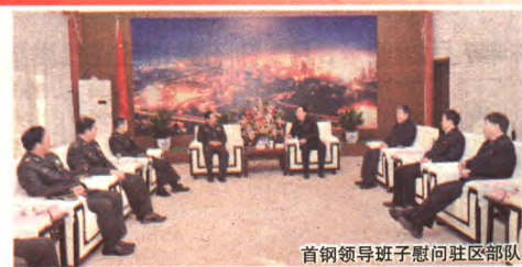
首钢领导班子慰问驻区部队