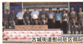
古城街道慰问驻区部队