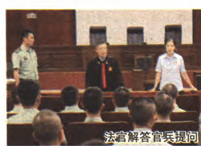
法官解答官兵提问