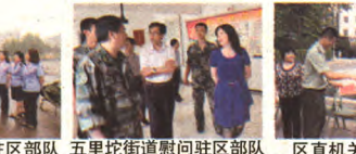
区工商分局慰问驻区部队