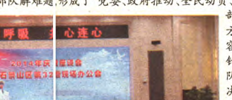
区统计局慰问驻区部队