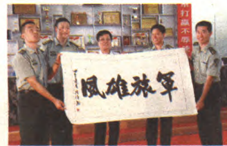
区政协主席岳德顺慰问基层部队