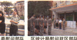
五里坨街道慰问驻区部队