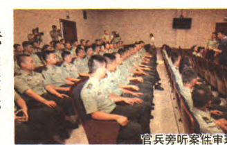
官兵旁听案庭审理

为了有效提高部队基层官兵的法治意识和依法维权能力,7月22日,区司法局联合区人民法院开展“法律拥军”活动,邀请部队官兵走进法院旁听、学习和交流,为部队官兵送上“节日大餐”。