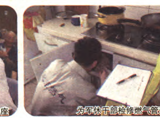
为军休干部检修燃气管道