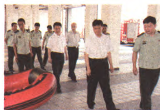
区委书记牛青山慰问基层部队