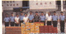
苹果园街道慰问部队