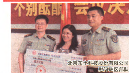
北京东土科技股份有限公司慰问驻区部队