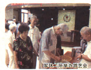
军休三所举办茶艺会