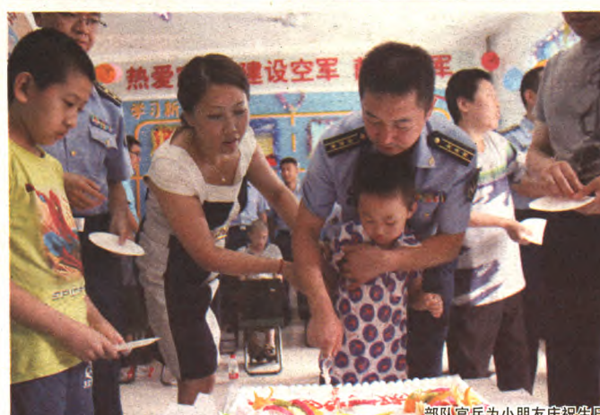
部队官兵为小朋友庆祝生日