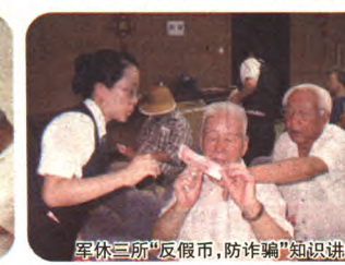
军休三所“反假币,防诈骗”知识讲座