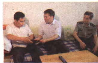
区人大常委会主任赵玉民慰问优抚对象