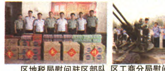
区地税局慰问驻区部队