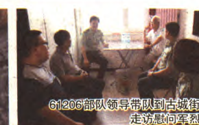
61206部队领导带队到古城街道走访慰问军烈属