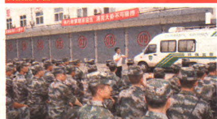
区环保局与区武装部在电子对抗团联合开展了以“控制PM2.5污染,建设绿色军营”为主题的环保宣传活动