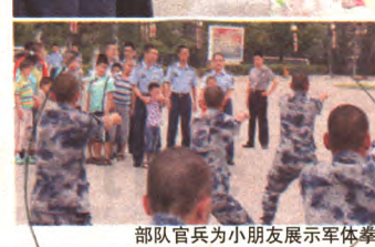
部队官兵为小朋友展示军体拳

八一建军节前夕,93658部队将北京“小飞象”训练发展中心的17名自闭症儿童患者请进军营,开展了丰富多彩的“军营一日游”活动。