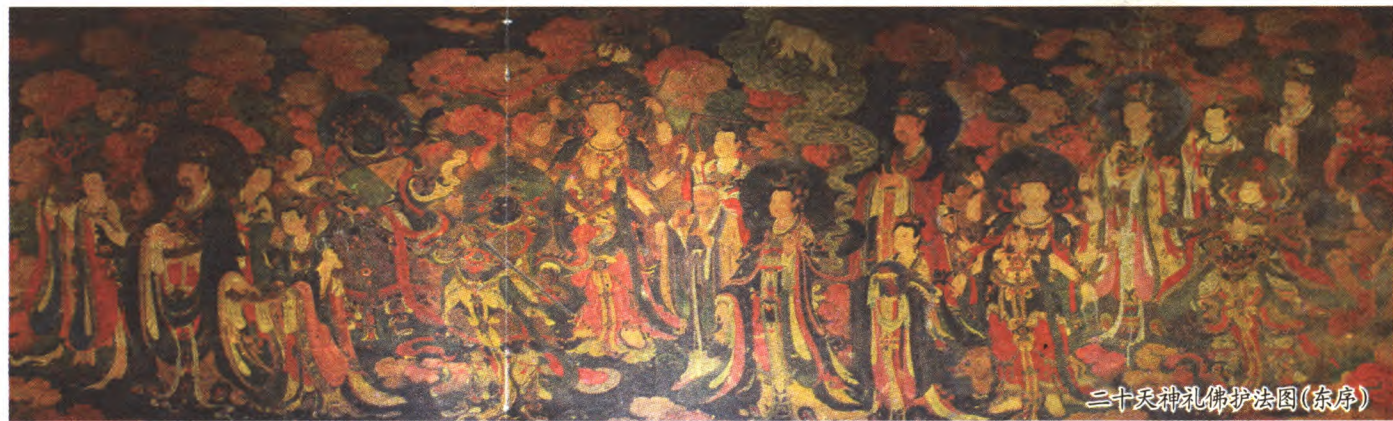
二十天神礼佛护法图(东庑)

大雄宝殿扇面墙后壁绘有“三大士图”,观音居中,左为文殊,右为普贤。各高4.5米、宽4.5米,每铺壁画面积20.25平方米。三大