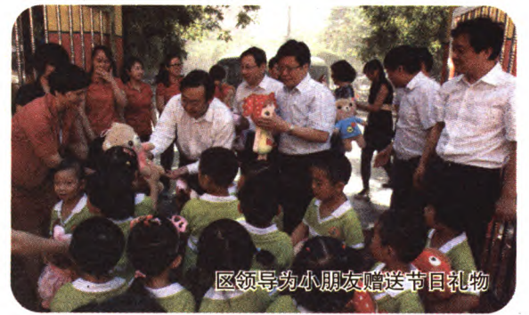
区领导为小朋友赠送节日礼物

4月18日,区妇联邀请北京动动鞋子儿童剧团来到蓝天宇峰幼儿园表演传统戏剧“老鼠招亲”,通过孩子与演员的互动,让孩子们近距离的接触戏曲文化,感受传统文化浓郁气息。