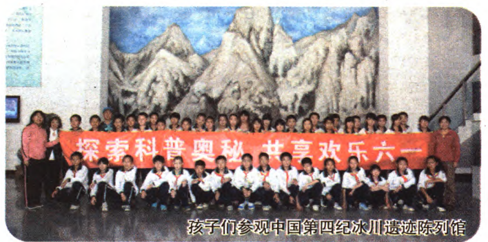
孩子们参观中国第四纪冰川遗迹陈列馆

5月16日,区妇联组织流动儿童参观第四纪冰川馆,让孩子们了解关于第四纪冰川时代的基本情况,让孩子们了解科学、喜欢科学,插上科学的翅膀。