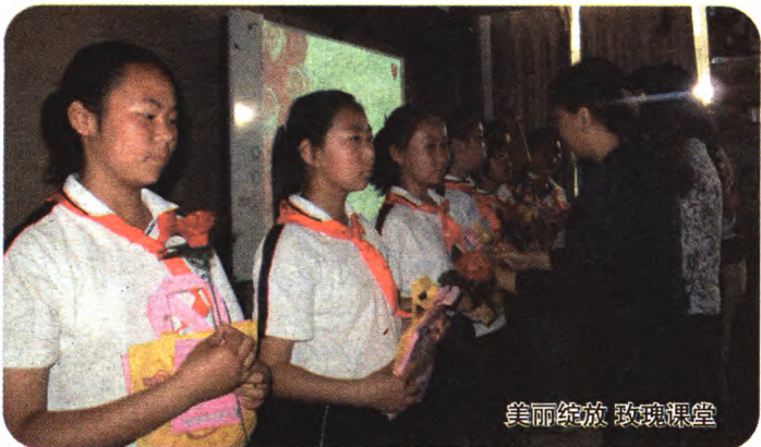
美丽绽放 玫瑰课堂

5月19日,区妇联在石景山区师范附属小学举办“美丽绽放 玫瑰课堂”活动。通过玫瑰课堂,让青春期女生了解自己的生理特点,让家长更关心孩子的成长,使老师和孩子之间沟通的渠道更