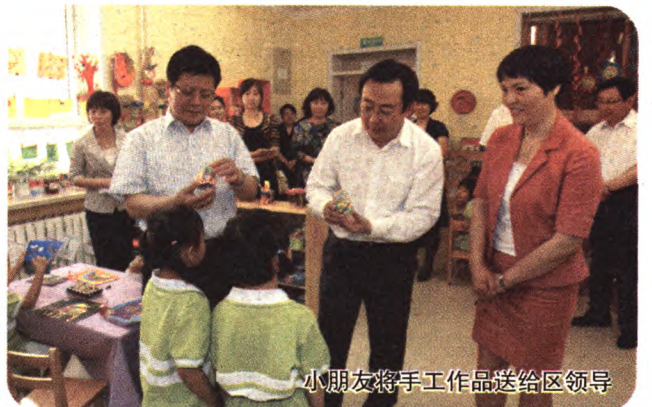
小朋友将手工作品送给区领导