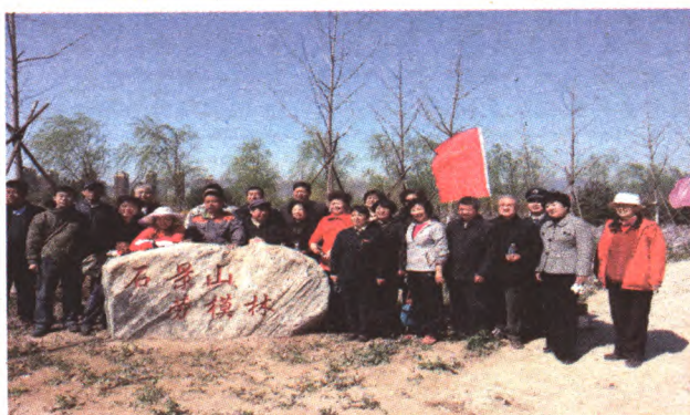
4月3日莲石湖劳模林揭牌仪式