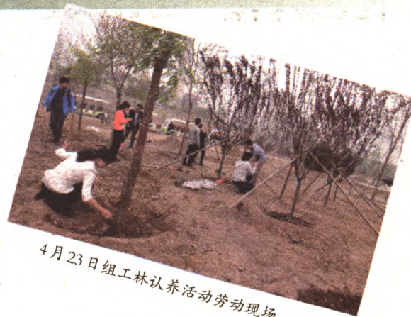
4月23日组工林认养活动劳动现场