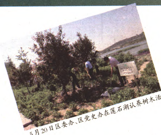
5月20日区委办、区党史办在莲石湖认养树木活动

今后,区绿化办还将进一步加大此项工作的工作力度,与社会各界一同携手建设绿色家园,让石景山天更蓝、树更绿、人更美!