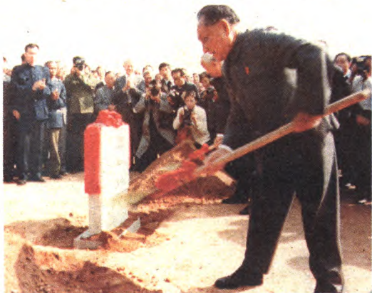
1967年7月1日，朱德、邓小平、彭真、李先念等领导在石景山区玉泉路为地铁一期开工奠基。