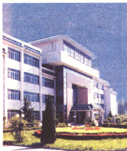
邓小平同志于1991年4月23日为驻区中央检察官管理学院(后更名为国家检察官学院)题写院名。