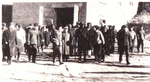
1958年，邓小平同志到首钢密云铁矿基地视察。