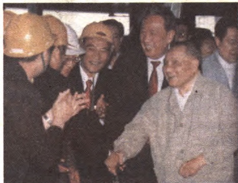
1992年5月22日，邓小平视察首钢总公司。