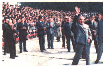
1988年10月24日，邓小平、杨尚昆、李鹏、万里、李铁映、姚依林、王震等中央领导到驻区中国科学院高能物理研究所接见北京正负电子对撞机工程建设者。