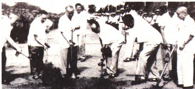
1984年，邓小平为驻区中国科学院高能物理研究所正负电子对撞机国家实验室奠基。