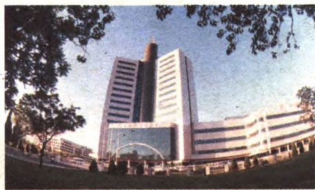
1987年9月，邓小平为驻区中国国际广播电台题写台名。