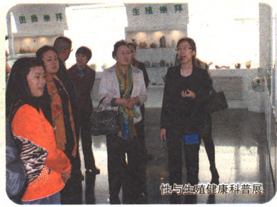
性与生殖健康科普展