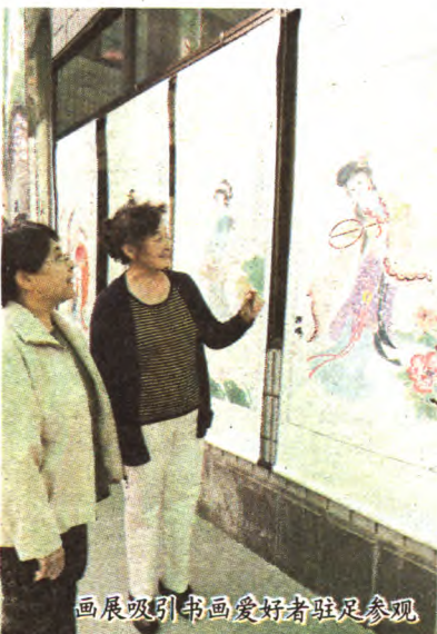
画展吸引书画爱好者驻足参观

目前,“人物”专题正在展出,师生们一幅幅画作色彩绚丽、笔工精妙,无一不体现了作者们深厚的功力,上百幅展出作品吸引不少书画爱好者前来观赏。区老年书画研究会举办的这次师生绘画作品展时间之长,内容之广,数量之多,均为历年之最。