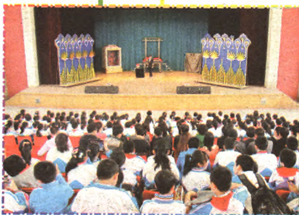
中小生观看“金玲魔法世界”魔术表演