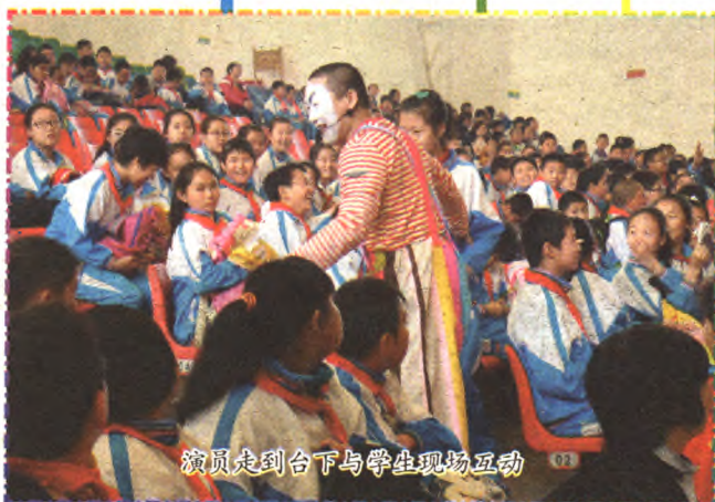
演员走到台下与学生现场互动