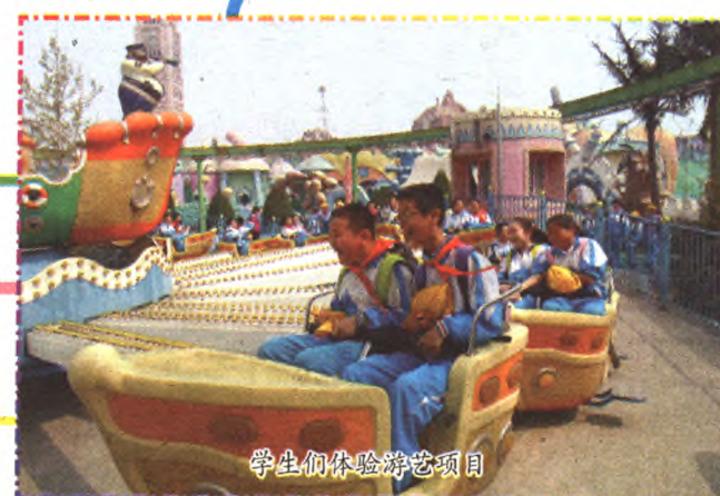
学生们体验游艺项目