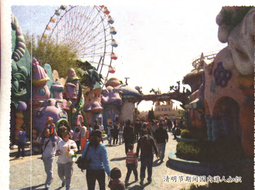
清明节期间园内游人如织

清明节小长假,游乐园经营再传捷报。3天接待游客4.15万人次,同比增加52%;经营收入337万元,同比增加55.1%,取得了经济效益和社会效益双丰收。