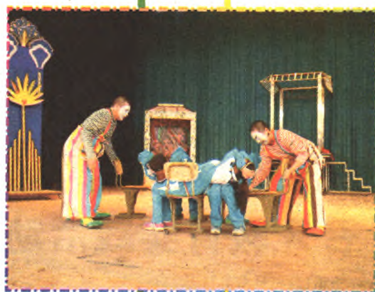
学生们亲身体验魔术当中的科学原理