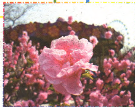
春日的游乐园内桃花烂漫

2014年,石景山游乐园领导班子紧紧围绕区委、区政府“全面深度转型,高端绿色发展”的战略目标,以企业规范经营和改革发展为抓手,提出了“安全、规范、服务、创新”的工作方针,抓班子带队伍,员工队伍稳定,经营收入不断“上扬”。截至3月底,接待游客39.6万人次,同比增长13%;综合收入2006万元,同比增长22.5%,实现全年经营指标“开门红”。