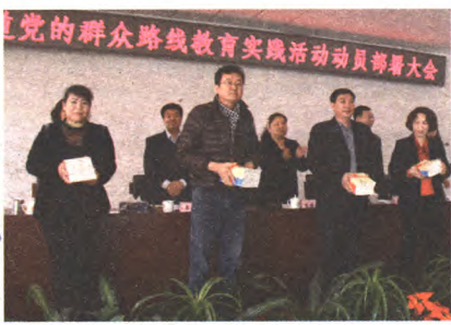
群众路线教育实践活动“部署会”

市委、区委对八角街道开展教育实践活动高度重视,市委常委、宣传部长李伟把八角作为联系点,区委牛青山书记也亲自督导联系八角,给予工作直接的指导和帮助。街道及时成立教育实践活动领导小组,由党政双正职任组长,班子成员参与组织领导和督导,抽调骨干力量组成五个工作组,加强对活动的统筹推进。街道还及早谋划,启动“3+1”组合拳预热活动,即通过举办教育实践活动“取经会”,组织思想理论“补课会”,召开街道各层次部署“动员会”,开展“党务政务公开日”,以直面问题、直面群众、立行立改的方式为教育实践活动开了好局,作了动员,营造了氛围。