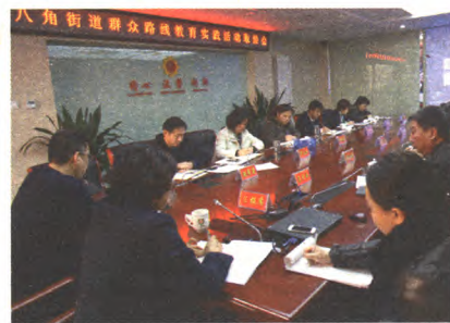
群众路线教育实践活动“取经会”