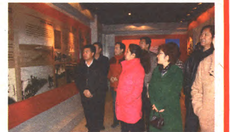
参观北京市反腐倡廉警示教育基地