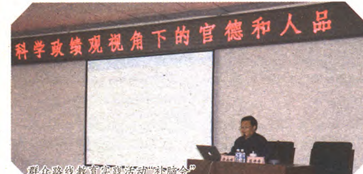
群众路线教育实践活动“补课会”