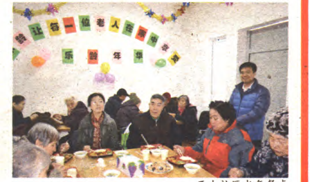
开办社区老年餐桌