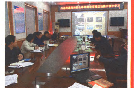
领导班子理论集中学习

人、群众工作能手、优秀十星党员”三个一百的争创评选活动;二是突出文化引领,开展“一家亲、百姓情”群众原创作品征集演出活动,把党组织的要求变成了群众的自觉行动。在交流形式上,开设工委书记群众路线大课堂,办事处主任群众工作大讲堂、处级领导干部“一刻钟微党课”;在处级干部中开展“传承红色基因,幸福文明的首善街道”微信公众平台群众路线专栏,红色短信推送,推进基层服务型党组织建设和“一体化”社会服务管理创新结合