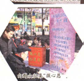
向群众征集“微心愿”