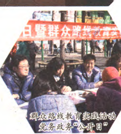
群众路线教育实践活动党务政务公开日