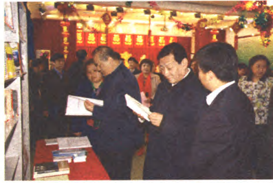
市委常委、宣传部部长李伟到八角街道调研工作

头不换”,始终聚焦“四风”问题;要加强基层服务型党组织建设,落实组织体系。八角街道的一些做法很有特色,要继续坚持,并在教育实践活动中,进一步积累经验、转化成果,更好地把服务理念变成党员干部的自觉行动,把基层服务型党组织建设作为重要任务;系统梳理、研究规范、整合载体、不断深化,形成集聚效应、品牌效应,探索一条基层服务型党组织建设的特色路径,不断加强和完善组织体系建设,真正把群众的事办好、办实,让群众感受到新变化、新气象。