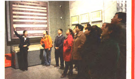
参观复兴之路展览