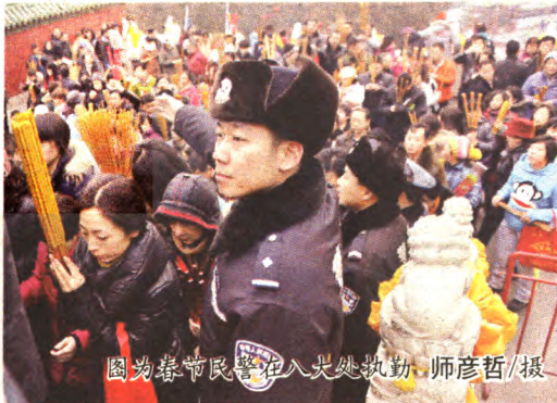
图为春节期间民警在八大处执勤

春节期间,石景山区公安分局在石景山区委区政府和北京市局党委的领导下,结合实际、及早动手、精心组织、周密部署,扎实推进各项安保工作,全区110警情始终处于良好等级。在此期间,全体民警充分发扬顽强拼搏、连续作战的优良传统和工作作风,舍小家、为