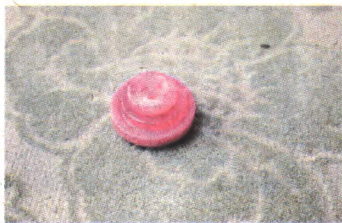
②三颗扣子由小到大落在一起