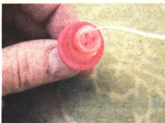
③用细铁丝将三颗扣子穿起