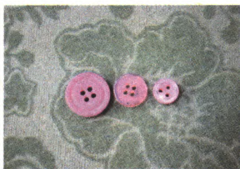
①选三颗扣子, 颜色自由搭配

纽扣花束看起来很漂亮吧, 放到房间里的任何一个角落都能给那里带来一个春天, 而且制作过程也不难, 最主要的是省钱啊, 大家快来学一下吧。