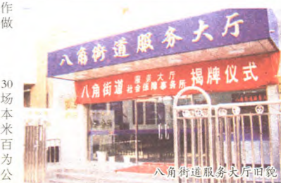
八角街道服务大厅旧貌