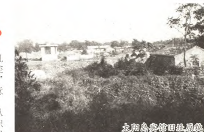
太阳岛博物馆旧貌

十八大召开以后,街道在全区率先开展了“中国梦·我是追梦人”主题实践活动,组织了征文、演讲、宣讲、文艺演出等一系列活动近50余次;在19个社区全面开展“道德讲堂”建设工作,广泛开展群众性道德教育实践活动。12支文艺团队,连续九年举办的社区艺术节、老年艺术节,连续八年举办的“八角杯”全民健身运动会,让居民健康和科学文化素质水平有了大幅提升。