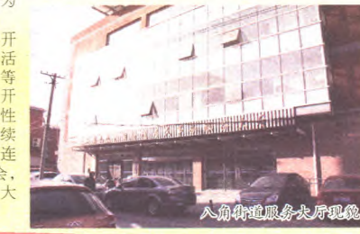
八角街道服务大厅新貌