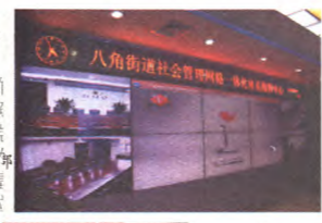
八角街道社会管理网格化指挥中心

深化项目化管理丰富党建活动载体。项目化管理是八角街道的一个党建品牌。如今,街道的经验做法已在全区得到广泛推广,工作中坚持“项目化运作、品牌化建设”,对优秀党建创新项目进行奖励扶持,形成了鼓励党建创新的政策导向,打造了一批叫得响、立得住、传得开、特色鲜明的党建创新项目品牌。持续推广“文化大舞台”、“金色亲情”、“暮年生辉”、“快乐老年读报组”、“自助绿化”、“120担架队”、“牵手健康加油站”等成为党建特色项目。“金色亲情”是我们北路特钢社区的一个品牌项目,自2006年成立以来,目前“金色亲情”服务队的人数已达78人,服务项目12个,每月15号准时开展服务。服务范围近到区属各街道,远到东城、西城、朝阳、海淀、昌平、大兴等区县,大部分是慕名而来。先后被评为“北京市最佳党日活动优秀组织奖”、“市特色精品社区”、“首都优秀文明团队”。八角街道的党建项目丰富多彩、各具特色,先后接待柬埔寨、土库曼斯坦、日本东京、