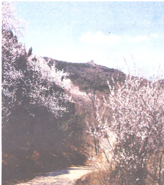
天泰山之春