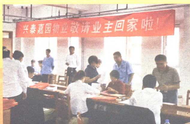
回新家啦——湿润气息摄影