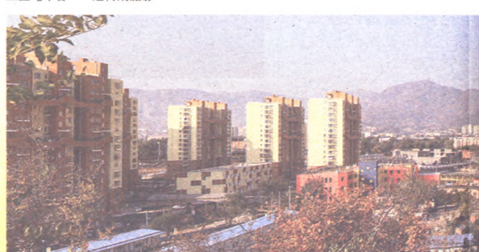
五里坨新区