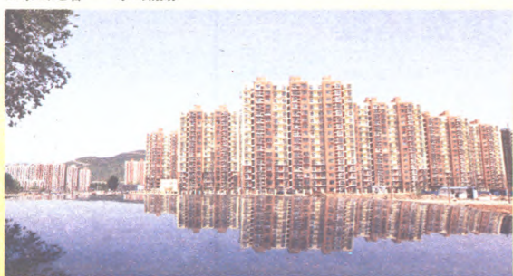
建设中的石景山西部