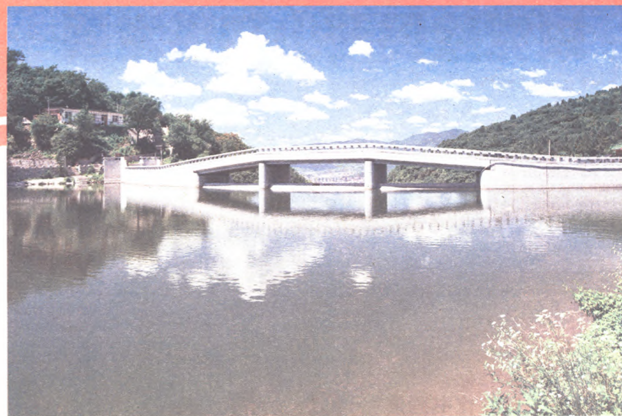
南马场水库