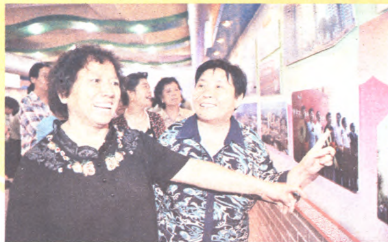
喜看家乡的变迁