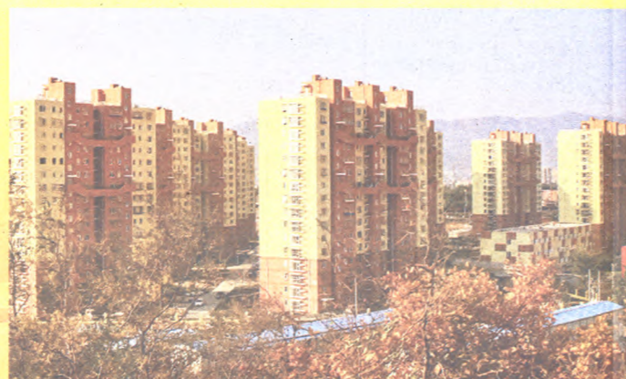
五里坨住宅新区