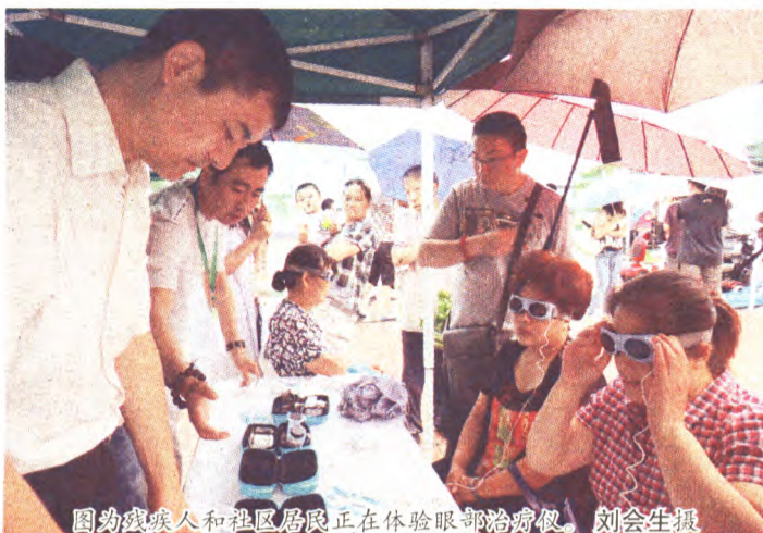
图为残疾人和社区居民正在体验眼部治疗仪。

以家庭康复培训学校为依托,开展康复训练进家庭是今年康复工作的一大亮点。区残联注重发挥“残疾人家庭康复培训学校”讲师团成员的专业特长,深入街道、社区家庭为有需求的残疾人和家属进行康复、护理知识培训,帮助残疾人在家庭、社区得到更好的康复训练。针对一些行动不便的