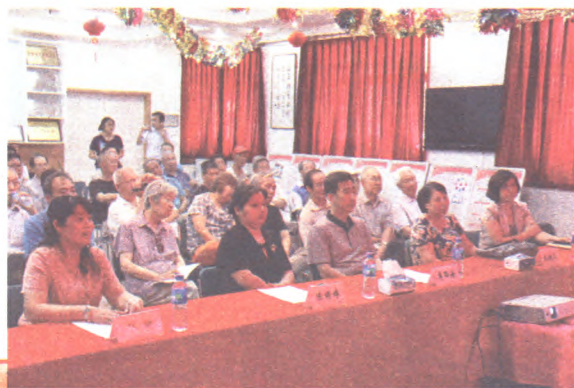
本版由区统计局、八角街道协办

讲解统计知识，让群众走近统计、了解统计，亲身体验统计工作，实际了解统计数据产生的真实过程。开展“感受CPI，共享好生活”主题活动，利用“统计大讲堂”，围绕百姓关注的热点、疑点，到社区举办统计知识专题讲座，为群众答疑解惑，提高了统计公信力。组织“送法进社区”普法宣传活动，开展“统计法”宣传、统计信息咨询，落实“六五”普法规划，为群众提供便捷的法律服务，满足社区群众的多层次需求。通过开展活动，社区居民越来越多的了解了政府统计工作，对统计调查项目给予积极配合、全力支持，形成社区、机关共谋发展、共建美好家园的良好氛围。