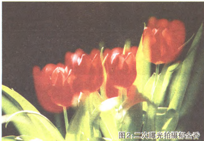
图2:二次曝光拍摄郁金香

5. 遮挡法多次曝光。 所谓的遮挡法,就是先遮挡镜头的一半拍摄一次被摄物体,然后再遮挡镜头的另一半拍摄一次不同位置的被摄物体,这样就可以将被摄物体同时曝光到影像传感器上(在胶片相机时代,这种方法常见于旅游景点)。不过使用数码相机拍摄的时候也可不用遮挡镜