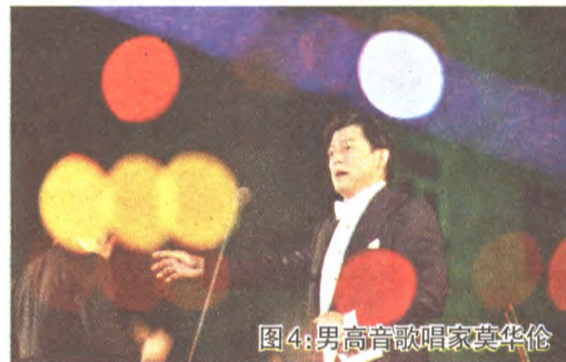
图4:男高音歌唱家莫华伦

7. 多次曝光可以超现实。 有时在拍摄现场并没有我们看到的图4这样的场景,而是通过多次曝光把不同的物体进行巧妙