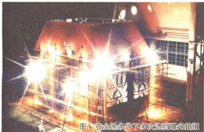
图1:在全黑条件下多次遮挡曝光拍摄

头。(如图1,在全黑条件下,采用遮挡镜头加星光镜的方法多次曝光拍摄。画面中的星光点以及产品内部的光线都是由一名工人完成的,拍摄时间长达30分钟。)