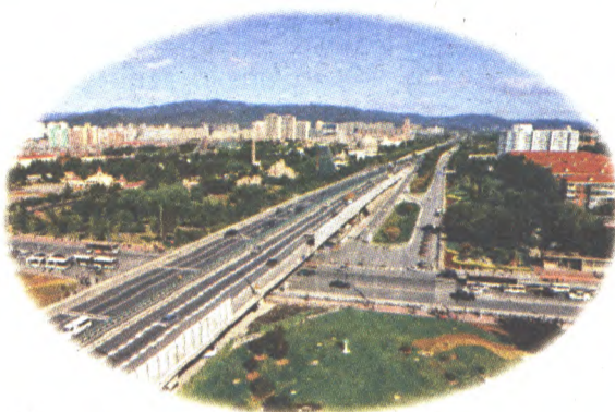
图2:用高机位俯拍的效果