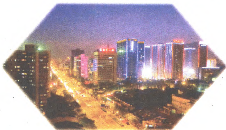
图5:夜间拍摄的效果

随着我国改革开放的不断深入,城市建设突飞猛进,社会发展日新月异,各种漂亮、新颖的建筑物拔地而起。京广大厦、中央电视台新址、国家大剧院等一大批造型奇特的标志性建筑展现在我们面前。而在我们身边,万达广场、鼎城商务区、京燕商务区以及远洋山水、金顶阳光、融景城居民区的不断崛起,也为广大影友提供了丰富的拍摄素材。面对这些风格迥异的建筑,我们应该怎样去表现它们呢?下面我们就简单介绍一下建筑摄影的小窍门。