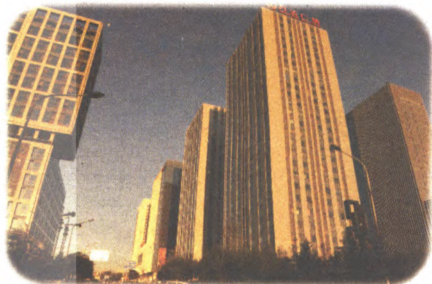
图1:用超广角镜头的拍摄效果