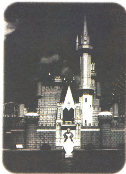
图3:加偏振镜拍摄的灰姑娘城堡