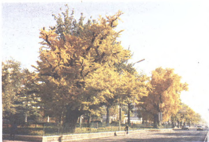
玉泉路旁银杏树

玉泉路地铁口西侧路北两株银杏树,是元代灵福寺遗址遗存树木,至今已有700多年,为一级古树。