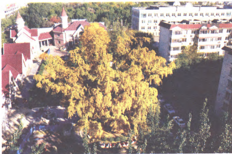
宝宝乐园的古银杏树

相传这棵银杏树原本已经近乎枯萎,但是自从这里建成了宝宝乐园后,孩子们坐在电动小火车上一圈圈地围着树干转。好像银杏树也被孩子们的朝气感染,枯黄的树干长出新枝嫩叶,生机勃勃,成为了石景山一处让人感受温暖与传承的独特景致。