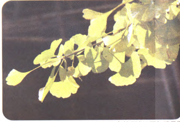
八宝山银杏掠影(组图) 岳星摄