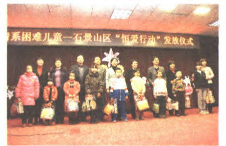
系困难儿童—石景山区“关爱行动”发放仪式

在社会救助依托政府主渠道的同时，石景山区妇联积极协调发动各方，挖掘社会资源，构建社会化救