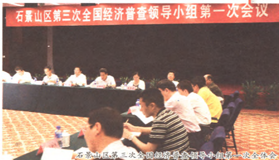
石景山区第三次全国经济普查领导小组第一次全体会议

为了让普查对象以及社会各界了解普查的目的和意义,掌握普查的内容,积极参与普查,本期报纸将从不同角度为读者解读经济普查,使您能全面了解经济普查、关注经济普查,普查工作需要您的支持与配合。