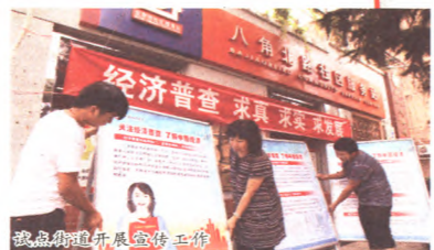
我处街道开展宣传工作的宣传车

各级编制、民政、税务、工商、质检以及其他具有单位设立审批、登记职能的部门,负责向同级经济普查机构提供其审批或者登记的单位资料,并共同做好单位清查工作。