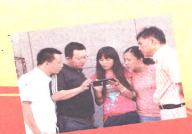
普查员试用手持电子终端设备(PDA)