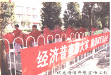
试点街道开展宣传工作的宣传车

第三十三条 经济普查取得的单位和个人资料,严格限定用于经济普查的目的,不作为任何单位对经济普查对象实施处罚的依据。