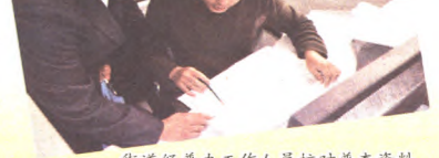
街道经普办工作人员核对普查资料

六是正式普查登记。2014年1月~4月,普查人员使用PDA上门定位拍照、核实相关信息,对所有普查对象进行普查登记,对普查数据进行审核、检查和验收。