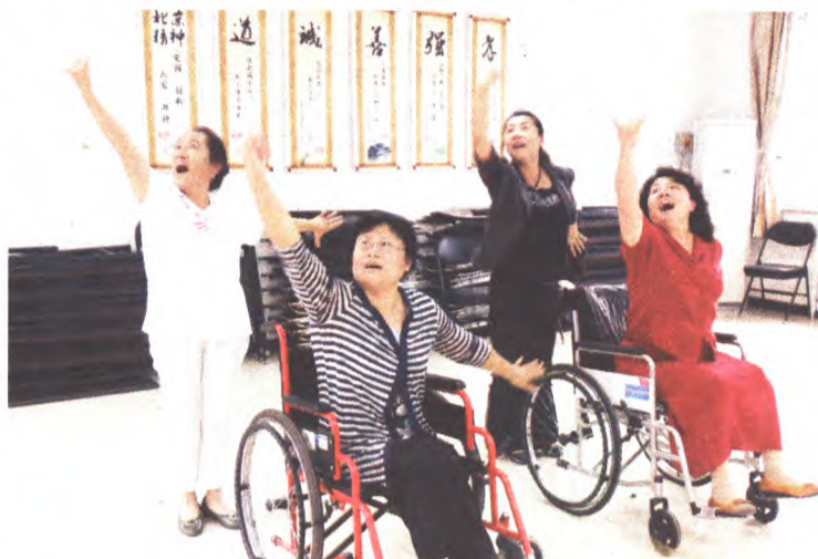
图为残疾人朋友正在排练轮椅舞。

“在只有两台轮椅走台时,必须互相配合,转小圈才行。”9月13日,在金顶街3区的活动室,金顶街街道海燕残疾人艺术团的5名团员正