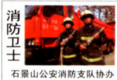
消防卫士 石景山公安消防支队协办