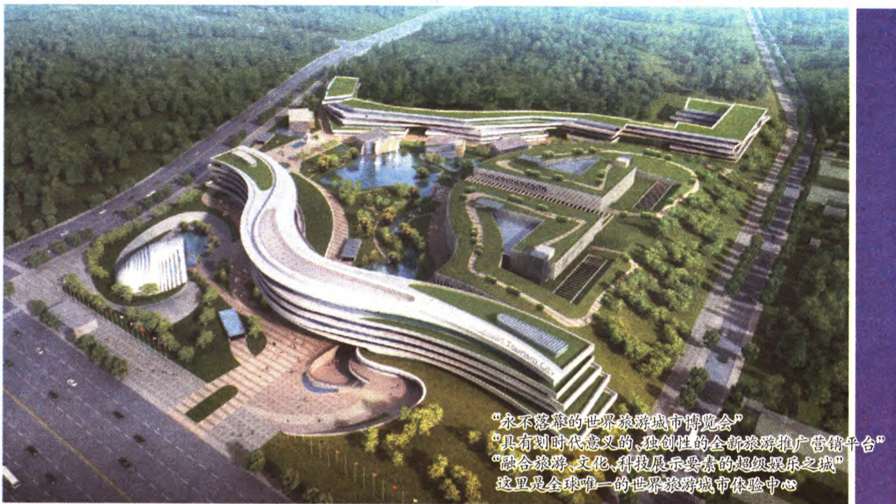
“永不落幕的世界旅游城市博览会” “具有划时代意义的、独创性的全新旅游推广营销平台” “融合旅游、文化、科技展示要素的超级娱乐之城” 这里是全球唯一的世界旅游城市体验中心

体验中心内,通过对综合体验馆和接待中心的室内WIFI覆盖,以及对体验中心全园室外WIFI热点覆盖,打造了一张无缝连接高速稳定的WLAN网络,使人们在享受各个旅游城市优美风光的同时,可以借助高带宽以及稳定的网络,随时随地发布信息,与自己的亲朋好友共享。