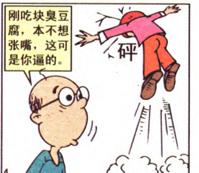
被逼无奈 青年楼社区 张志刚