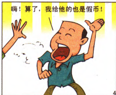
黑吃黑 青年楼社区 张志刚