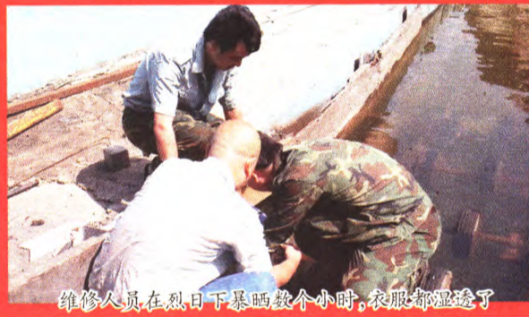
维修人员在烈日下暴晒几个小时，衣服都湿透了