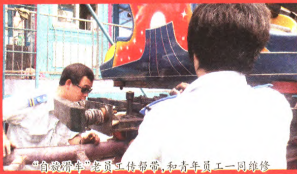
“自旋滑车”老员工传帮带，和青年员工一同维修