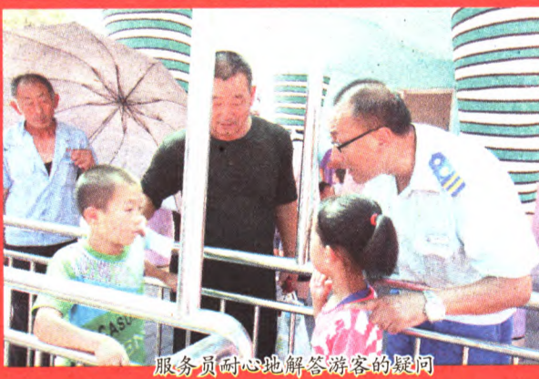
服务员耐心地解答游客的疑问