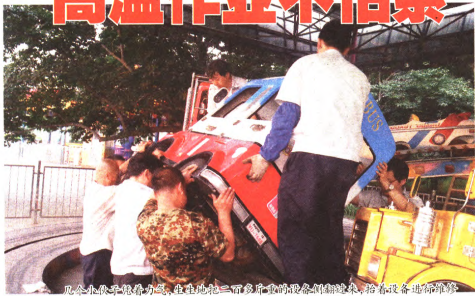
几个小伙子凭着力气，生生地把二百多斤重的设备侧翻过来，抬着设备进行维修

暑假期间，石景山游乐园全体员工战高温、斗酷暑，顶着炎炎的烈日，扎实工作，积极创收，在确保安全运营的基础上，不断提高服务品质，用自己的实际行动诠释着“安全、规范、服务、创新”的经营理念，赢得了广大游客的信赖和好评。