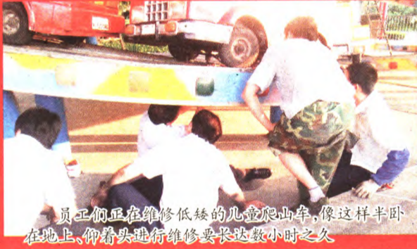
员工们正在维修低矮的儿童爬山车，像这样半卧在地上，仰着头进行维修要长达数小时之久