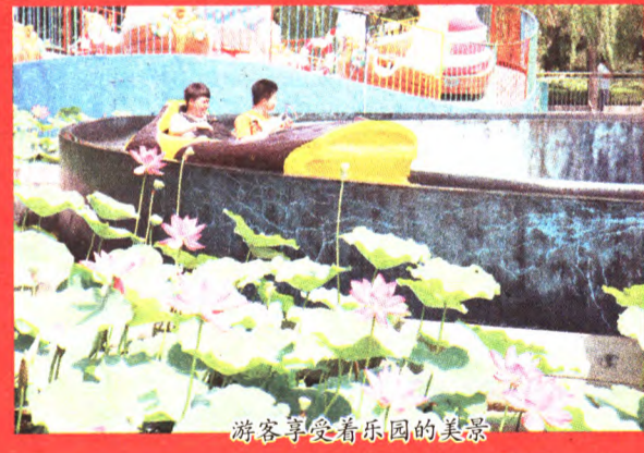
游客享受着乐园的美景