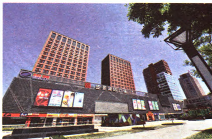
盛景国际广场外景