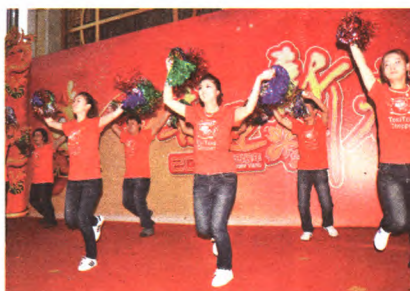
春晚节目精彩纷呈