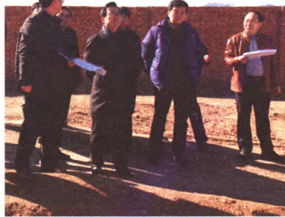
区委副书记、区长夏林茂等领导到西部地区指导工作