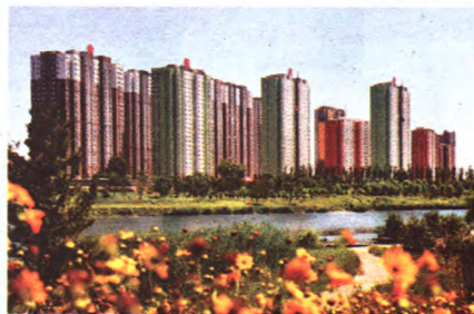
水泥厂保障房外景