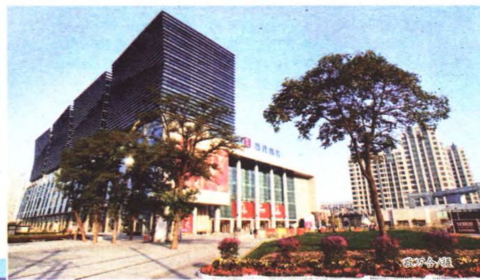
当代商城晶城店外景

战略调整做出新的贡献。在过去的十年里,石景山区土地储备分中心在为石景山区可持续发展储备土地的同时,也在储备着无私奉献的作风和开拓创新的勇气,储备着一笔又一笔宝贵的精神财富和推动事业向前发展的巨大能量。因此,我们有理由为十年前的那一次选择而自豪,有理由为十年来的每一次拼搏而骄傲、为在今后十年乃至更长的时间里不断攀越新的高峰而信心百倍。