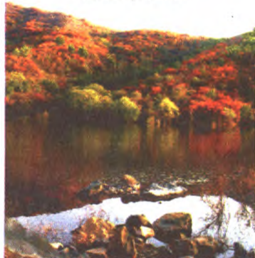
南马场水库秋色浓

@maryandsally event.weibo.com/2477371391