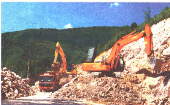
黑石头村路北段大修工程