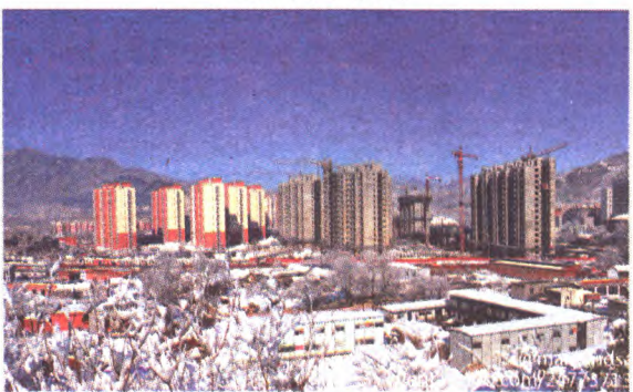
建设中的五里坨居民新区

@maryandsally event.weibo.com/2477371391