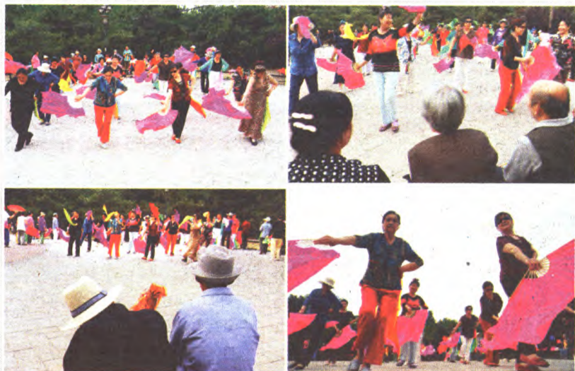
夕阳红——欢乐大秧歌