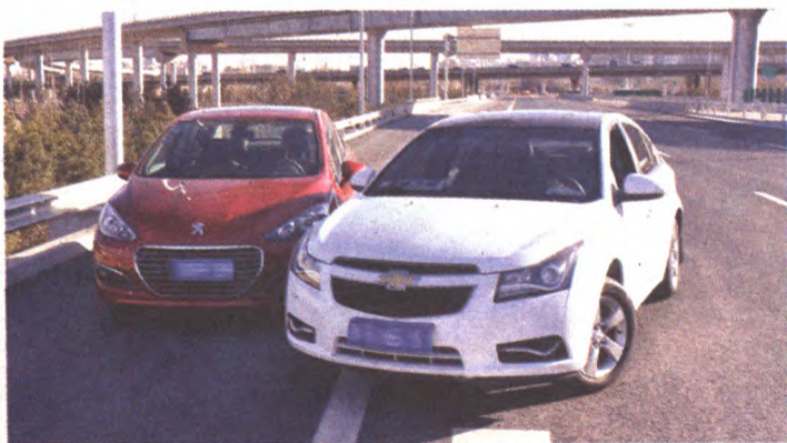
在警察来之前为了不影晌后方交通，可以先进行拍照留档案。你所拍的照片要包含：事故车辆、路面的交通标志。如果可以的话前后左右多拍几张