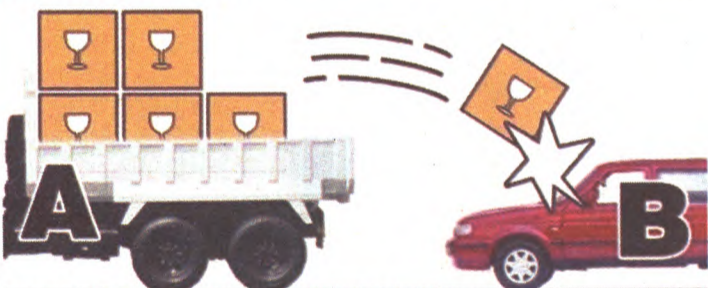
发生事故后，责任方逃逸，这种情况不计免赔很难生效。