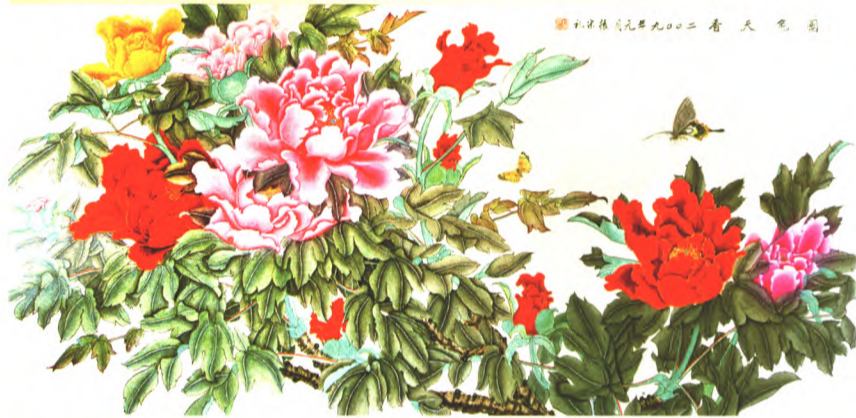
张宗礼九二二春天画