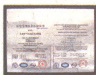
质量管理体系 认证证书