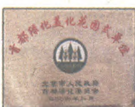
首都绿化美化 花园式单位