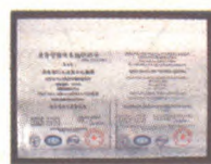
环境管理体系 认证证书