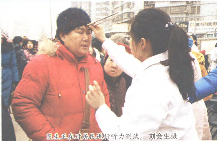
医生正在对居民进行听力测试。

当老年人出现听到别人的谈话却不太明白、要求别人重复他们所说的话和电视的音量调得比以前大等状况时,就应尽早带老人到