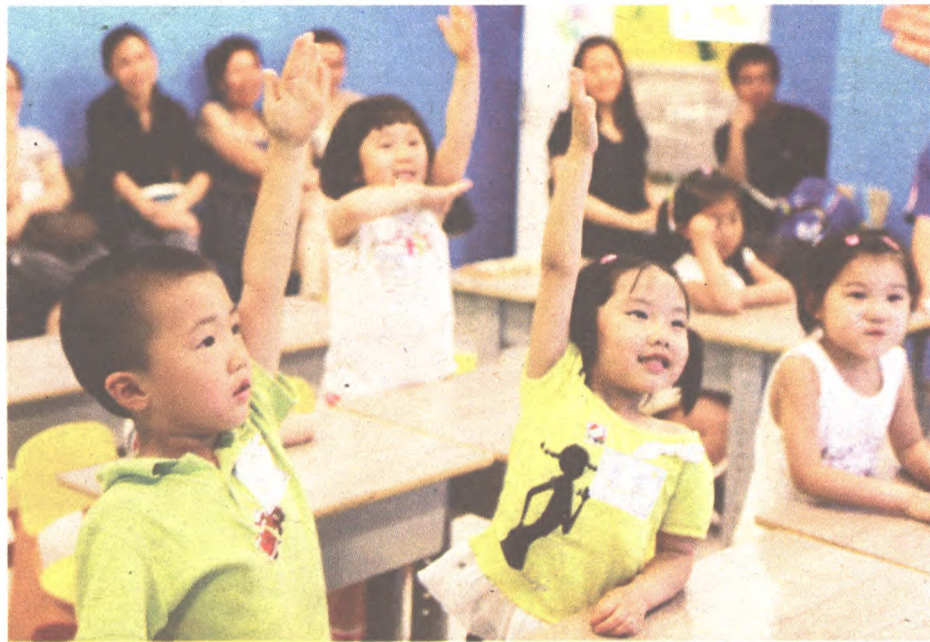
摩比课堂深受学生欢迎

样要多元化”，在学而思全新的教育理念中，还提出了不少值得注意的法则。比如：“老师，不要和孩子争夺成就感”、“家长，请不要给孩子讲题”、“不恰当的激励方式会适得其反”、“不用担心孩子看故事书和动画片”、“有益学习的‘五大习惯’与‘十二级品格’”等等，从“激发兴趣、培养习惯、塑造品格”三大角度，帮助家长和孩子找到有效的教育方法。