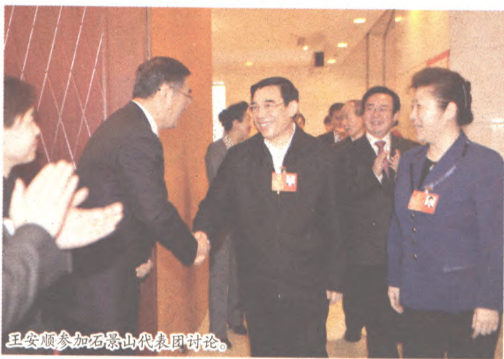
王安顺参加石景山代表团讨论。

济、科技、民生、环境、交通等问题争相发言,表达自己的看法和建议。代市长王安顺,市政府秘书长孙康林对代表们的发言频频表示赞许。据了解,近年来,市人大的第一次会议市长就参加石景山代表团的讨论,这是第一次,表现出市委、市政府对西部地区转型发展的高度关注、支持。 据悉,2012年石景山区地区生产总值达到345亿元,增长幅度与全市持平。一般财政收入持续6年保持2位数增长。社会消费品零售额183亿元,比上年增长13%,在城六区排名第一。固定资产投资144.8亿元,比上年增长10.6%。人均可支配收入34810元,比上年增长9%。区域经济发展态势良好,为北京市整体的发展作出了应有