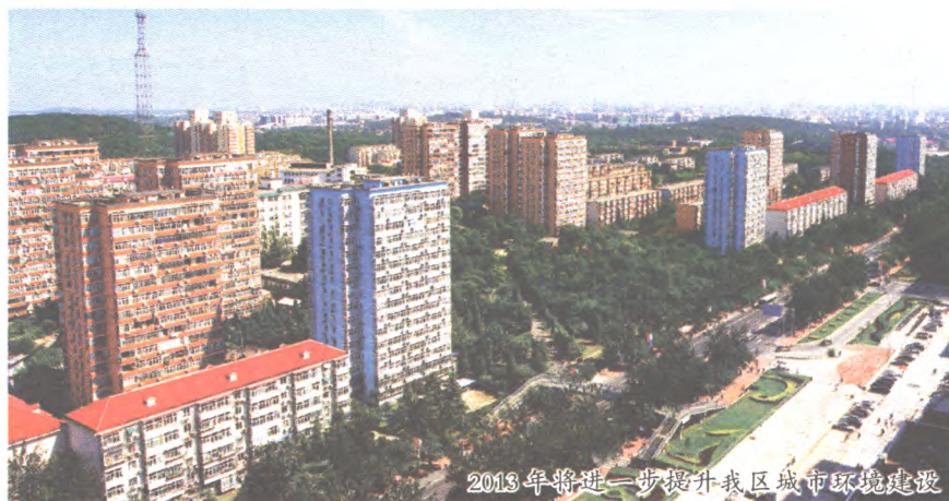
2013年将进一步提升我区城市环境建设