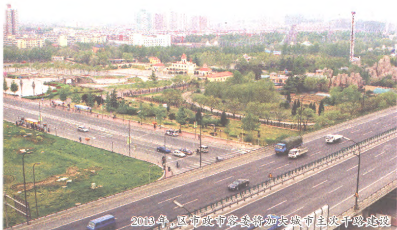
2013年,区市政市容委将加大城市主次干路建设

城西街等5条城市次干、支路建设工程。道路建设将对沿线居民出行带来便利,同时大大改善周围交通环境,尤其是西部地区交通主干路的建设,将提高居民出行效率。同时,加强市政交通精细化管理,完成银河商务区智能交通试点和指挥调度分中心建设,建设自行车示范街,方便市民“绿色”出行。