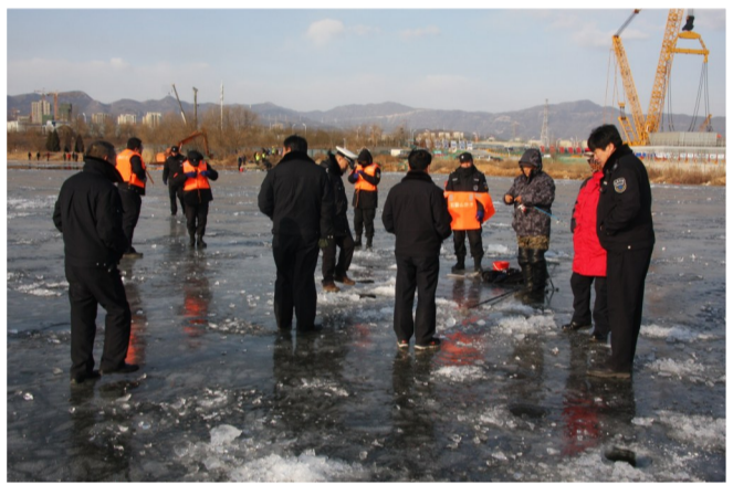
开展莲石湖冰钓清查整治联合行动