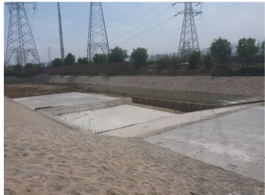
高井沟治理工程完工