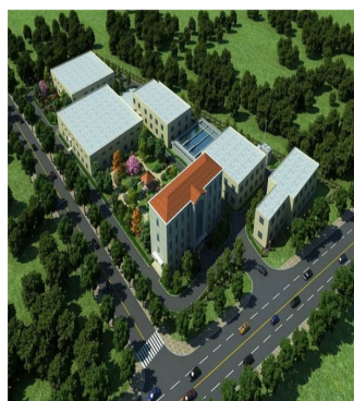
五里坨污水处理厂规划图

市试点工程建设,结合城市开发、旧城改造、市政基础设施建设项目,利用多种措施,大力实施雨洪控制与利用工程。加