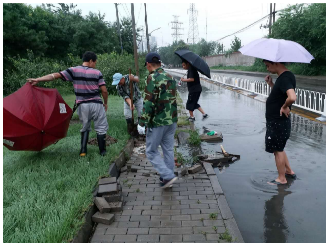
紧急疏通京原路水屯路路面积水

2017年石景山区水务工作在区委区政府的领导下,在市水局的指导帮助下,紧跟首都建设发展新步伐,积极探索水务建设可持续发展新思路,着力突出抓好以下六方面工作: