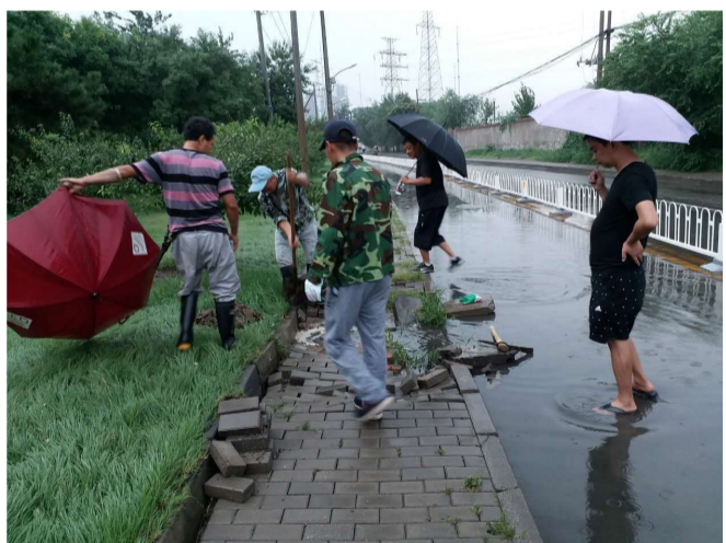
紧急疏通京原路水屯路路面积水