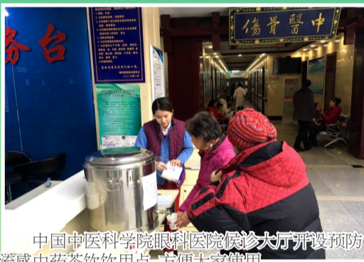
中国中医科学院眼科医院候诊大厅开设预防流感中药茶饮点,方便大家使用。