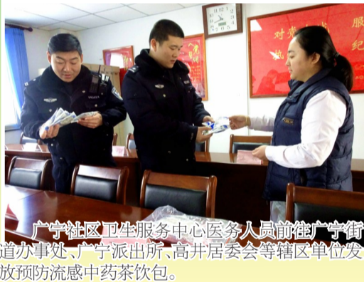
广宁社区卫生服务中心医务人员前往广宁街道办事处、广宁派出所、高井居委会等辖区单位发放预防流感中药茶饮包。