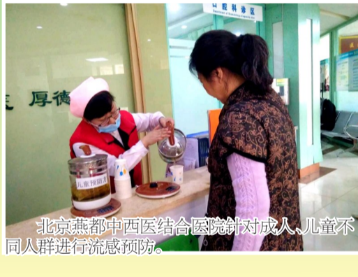
北京燕都中西医结合医院针对成人、儿童不同人群进行流感预防。

本报讯(通讯员王艳红)近期北方均进入流感冬季流行高峰季节,哨点医院报告的门诊急流感样病例比例高于过去3年同期水平,流感病毒检测阳性率已达往年高峰水平,且仍呈上升趋势。石景山区严格落实各项防控措施,在严密监测、科学防控、加强监督及健康宣教的同时,积极发挥中医治未病优势,在各中医医疗机构及10家社区卫生服务中心门诊均免费提供北京市中医管理局发布的流感方剂泡制预防饮,受到就诊患者的欢迎。