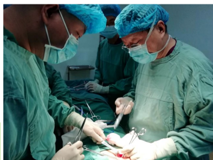
专家在顺平县人民医院进行手术演示。