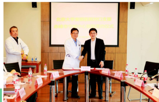
3月12日,北京大学首钢医院与内蒙古宁城县中心医院签署对口帮扶协议。

石景山区卫生计生系统将切实按照石景山区委、区政府的要求,认真开展调研,全面了解情况,科学落实总体工作计划,有序、有效、可持续地开展对受援四县(旗)医疗卫生工作的全方位帮扶,辖区医疗机构将积极发挥自身优势,提高四县(旗)基层医疗卫生服务水平。