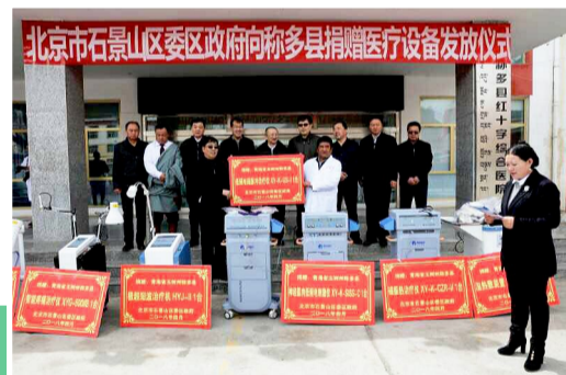
4月24~26日,区卫生计生委和称多县卫计局签订对口帮扶框架协议,并向称多县中心医院捐赠价值十多万元的理疗仪器。