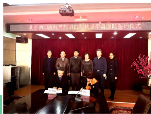
3月14日,北京朝阳医院西院与顺平县医院签署对口帮扶协议。