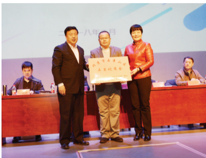
本报讯(通讯员徐艳丽)近日,区工商联五里坨街道商会召开成立大会。大会审议通过

了《石景山区工商业联合会五里坨街道商会章程》,选举产生了第一届石景山区工商联五里坨街道商会理事、副会长、秘书长、会长。区人大副主任、工商联主席马丽萍与街道负责人为新当选的商会理事颁发证书。